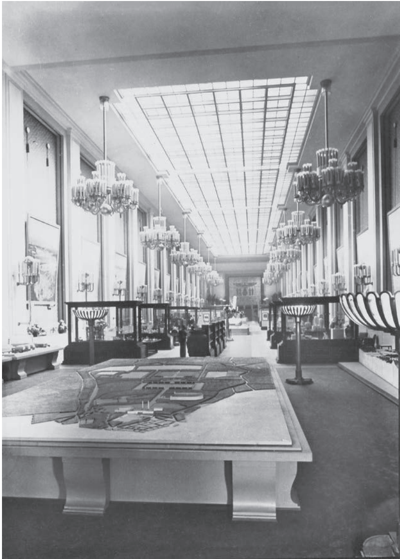
Heinrich Hoffmann: Weltausstellung 24. Mai-25. November 1937 (Blick in die Ausstellungshalle des Deutschen Pavillons), Fotografie, 12 x 9 cm, Beide Abb.: Bayerische Staatsbibliothek München Abtlg. Karten u. Bilder. © bpk | Bayerische Staatsbibliothek | Archiv Heinrich Hoffmann